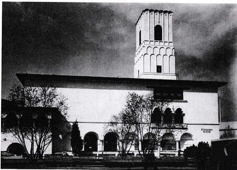
Casa Românească de la New York